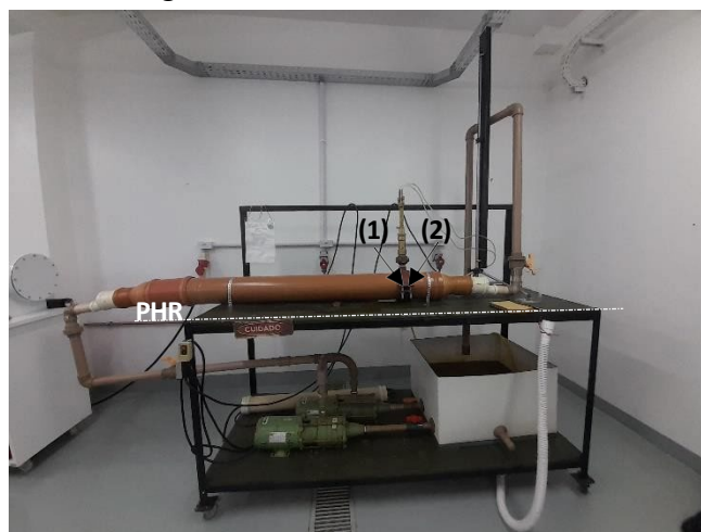
Figura 1 - Bancada de Pitot

Nesta aula prática, a expressão será aplicada em um tubo de Pitot. O pitot é um medidor de vazão por pressão diferencial e é empregado para determinar a vazão na tubulação de água tratada. Este tubo possui uma extremidade aberta voltada para o fluxo e outra fechada conectada a um instrumento de medição de pressão, permitindo calcular a velocidade do fluido pela diferença de pressão. Dois pontos são identificados para aplicar a Equação de Bernoulli: (1) na entrada e (2) na saída do tubo. Além disso, um ponto PHR é estabelecido, alinhado ao nível superior da base da mesa. Os dados foram retirados da bancada (Figura 1) e usados na equação conforme demonstrado nos resultados.