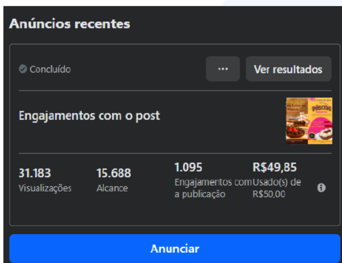
Figura 1: Resultados dos investimentos em anúncio digital. Elaborado pelos autores, 2025