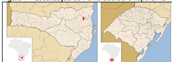
Figura 1 – Localização de Pomerode/SC e Ilópolis/RS

A distância entre as duas cidades em linha reta é de aproximadamente 380 km, ou 548 km através da BR-470 (Figura 01). A escolha dos estudos se justifica pela forte influência que as arquiteturas exercem sobre as cidades, atraindo a população local e aliando o turismo. Ambas as cidades fortemente colonizadas por europeus, utilizaram de sua arquitetura para fortalecer a conexão entre as pessoas e a comunidade por meio do envolvimento com atividades que retratam a herança dos imigrantes colonizadores dos municípios, salvando seus valores.