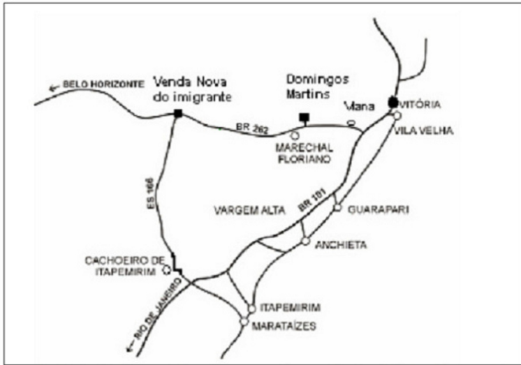
Mapa 1 – Principal rota do agroturismo entre Venda Nova do Imigrante – Domingos Martins e Marechal Floriano

No Mapa 1 é possível visualizar a grande área de concentração do agroturismo em Venda Nova e na região serrana.