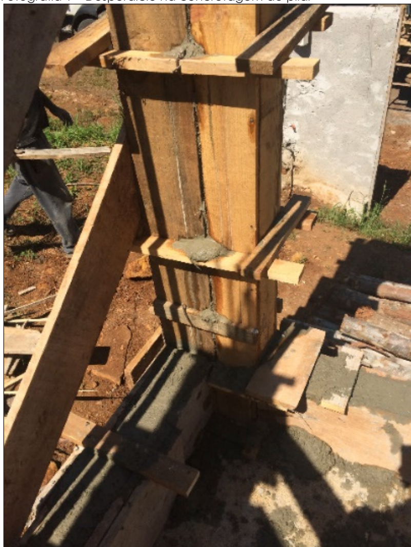
Fotografia 1 – Desperdício na concretagem do pilar

Para a concretagem do pilar da obra G, o desperdício de material foi 97% menor, visto que as formas eram estanques e durante o transporte da mangueira o bombeamento do concreto era interrompido, diminuindo significativamente a perda de material.