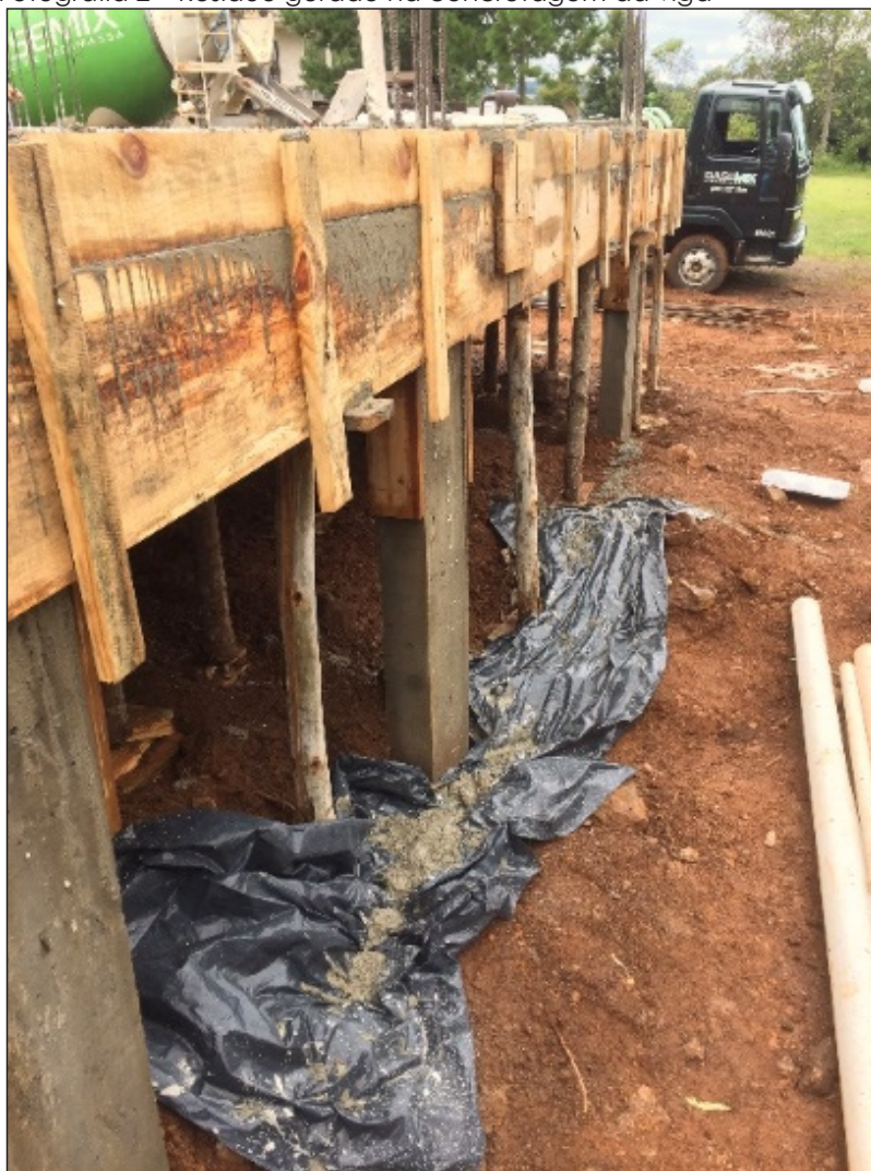
Fotografia 2 – Resíduo gerado na concretagem da viga