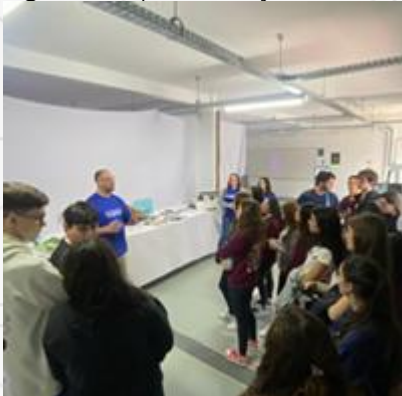
Figura 2- Apresentação do curso