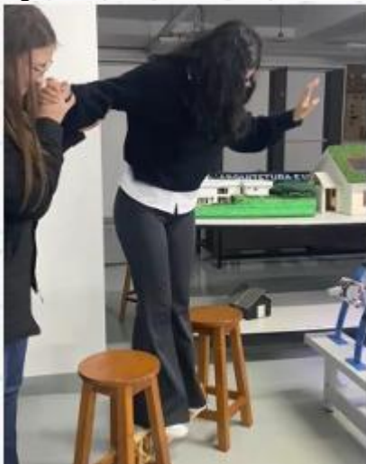
Figura 1 - estudante testando a ponte de palitos