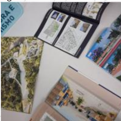
Figura 4 - Mostra de TCCs do curso