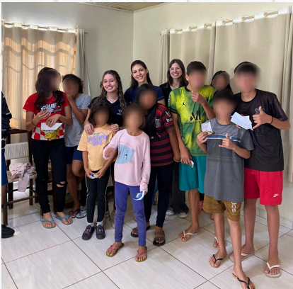
Foto com o grupo