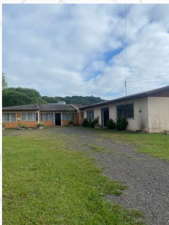
Fachada do CRAS