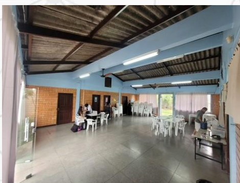
Ambiente do CRAS