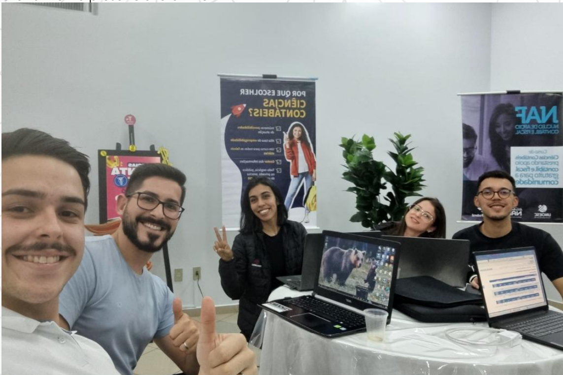
Figura 4 - Estudantes do Curso de Ciências Contábeis no Mutirão do Imposto de Renda 2025, atendimento presencial e online