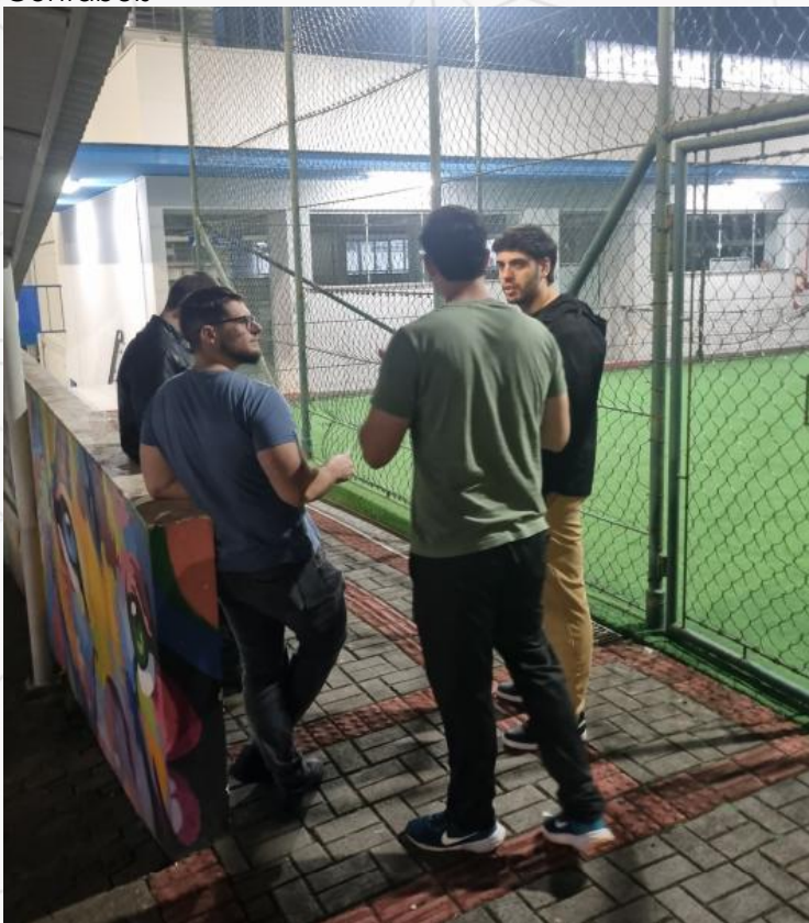
Figura 3 - Divulgação do Projeto Dirpf Cidadã 2025 pelos estudantes do Curso de Ciências Contábeis