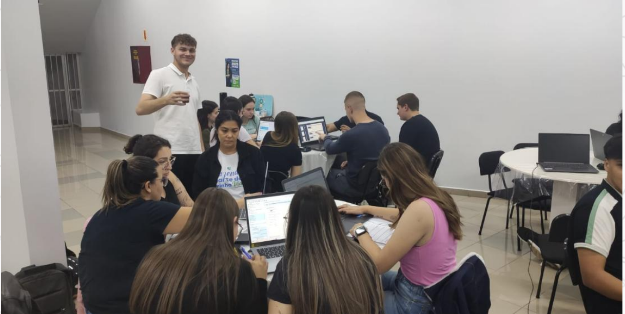
Figura 5 - Estudantes do Curso de Ciências Contábeis no Mutirão do Imposto de Renda 2025, atendimento presencial e online