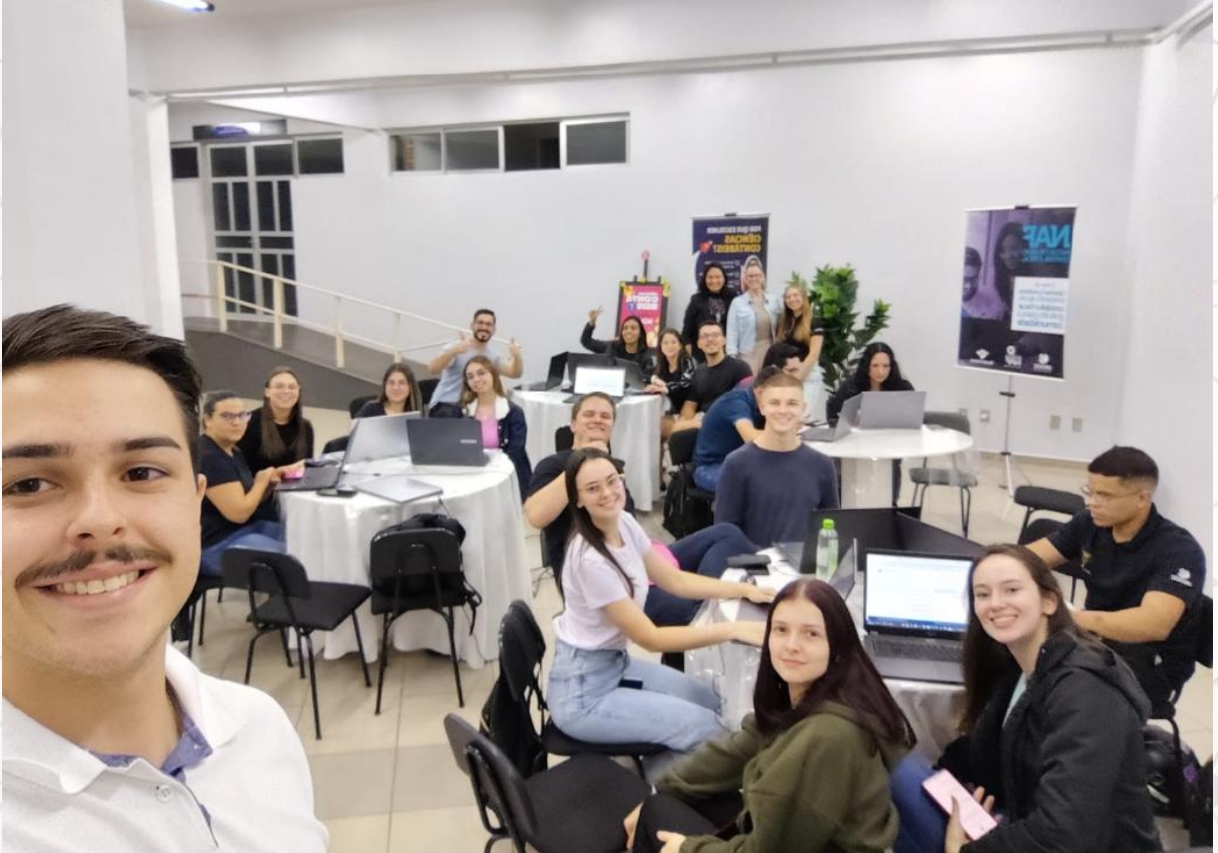
Figura 6 - Estudantes do Curso de Ciências Contábeis no Mutirão do Imposto de Renda 2025, atendimento presencial e online