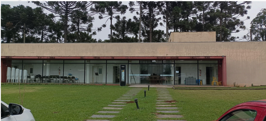
Imagem 03 - Local do estágio de observação