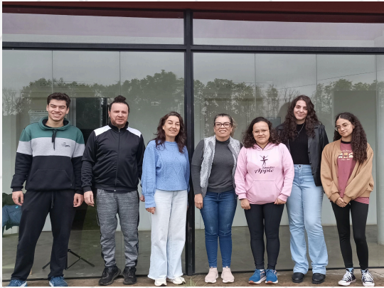
Imagem 02 - Equipe do centro com as estudantes de psicologia