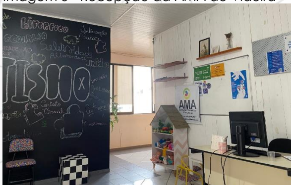
Imagem 3 - Recepção da AMA de Videira