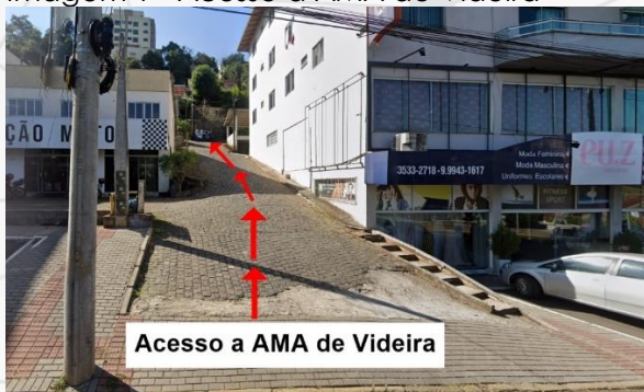
Imagem 1 - Acesso a AMA de Videira