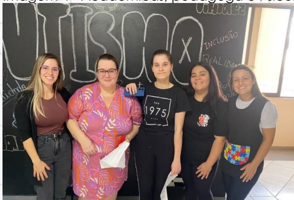
Imagem 4 - Acadêmicas, pedagoga e Psicóloga da AMA de Videira