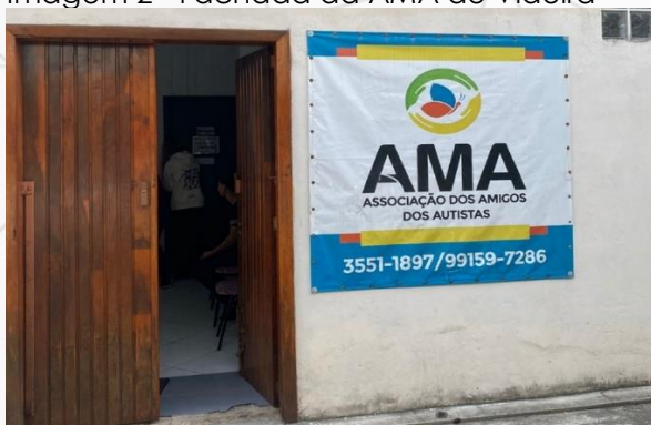
Imagem 2 - Fachada da AMA de Videira