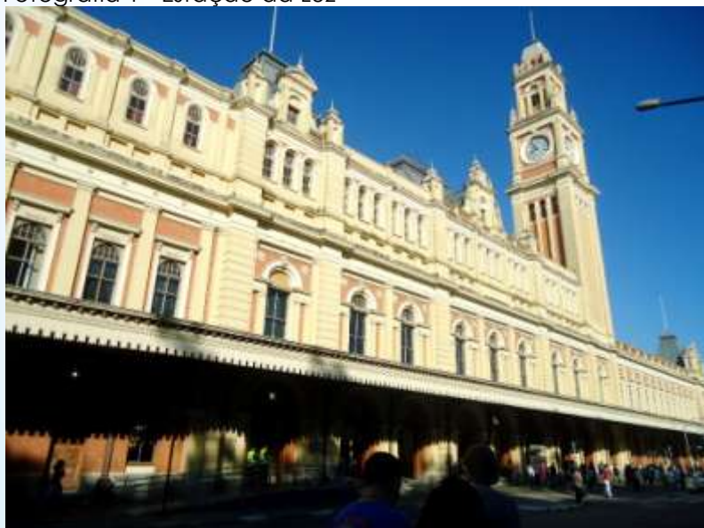
Fotografia 1 - Estação da Luz