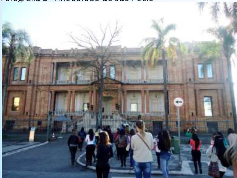
Fotografia 2 - Pinacoteca de São Paulo