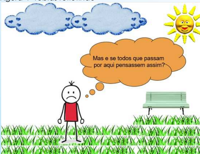
Figura 4 -Tobias refletindo