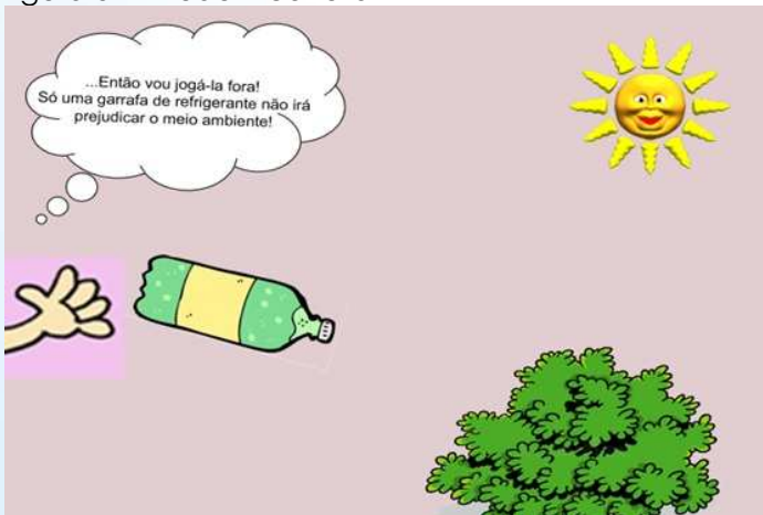
Figura 3 -Atitude incorreta