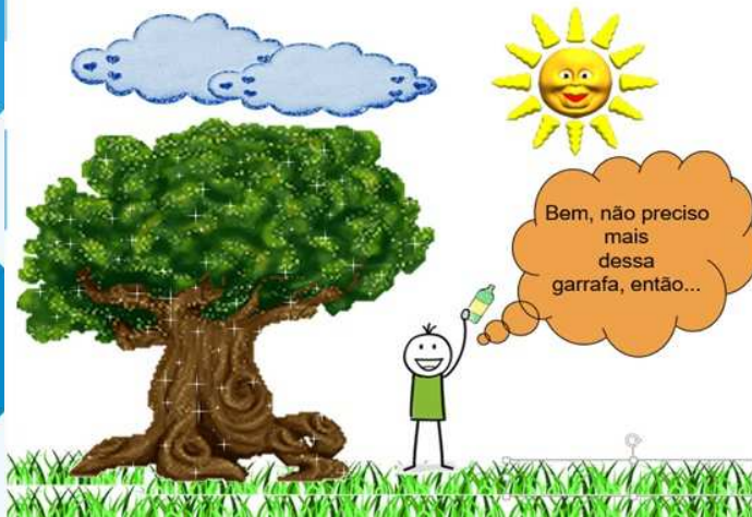
Figura 2 - Pensando no Meio Ambiente