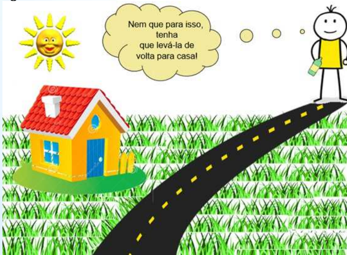
Figura 6 -Atitude nota dez