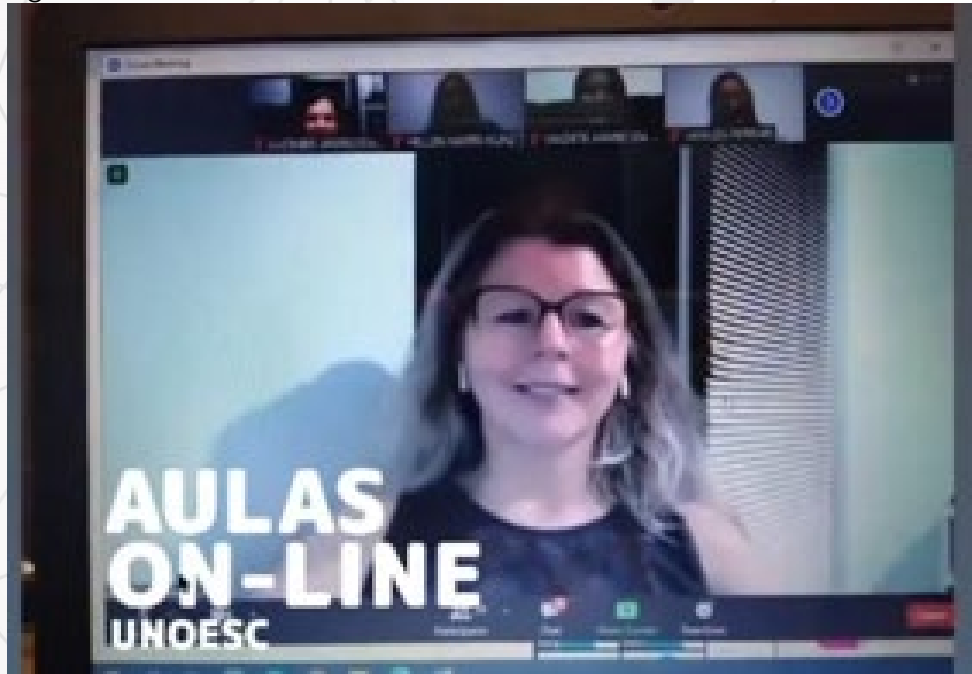
Figura 2 – Professora durante a Webconferencia