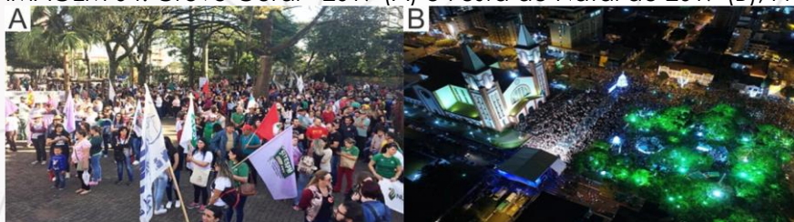
IMAGEM 04: Greve Geral - 2019 (A) e Festa de Natal de 2017 (B), Praça Coronel Bertaso.