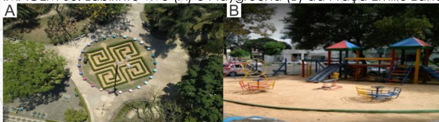
IMAGEM 06: Labirinto vivo (A) e Playground (B) da Praça Emílio Zandavalli, Chapecó - SC.