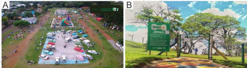
IMAGEM 01: Dia das crianças (A) e Espaço Vercão (B) Complexo Esportivo Verdão, Chapecó - SC.