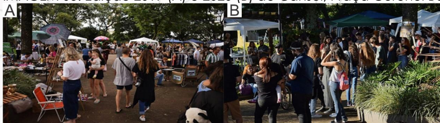
IMAGEM 05: Edição 2019 (A) e 2020 (B) do Cansei, Praça Coronel Bertaso, Chapecó - SC.