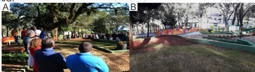
IMAGEM 03: Reinauguração (A) e Revitalização (B) da Praça Bernadete Roman, Chapecó - SC.